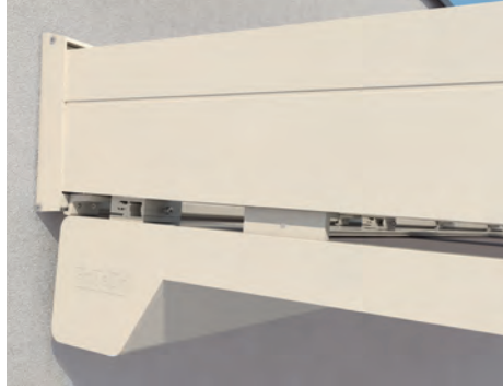
Klare Linienführung im Übergang Kasten zu Ausfallprofil