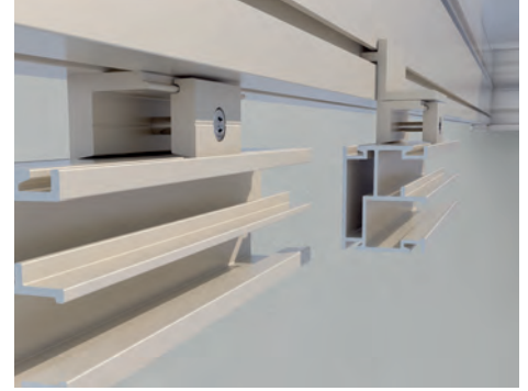
Aussenbündige oder eingerückte Montagemöglichkeit